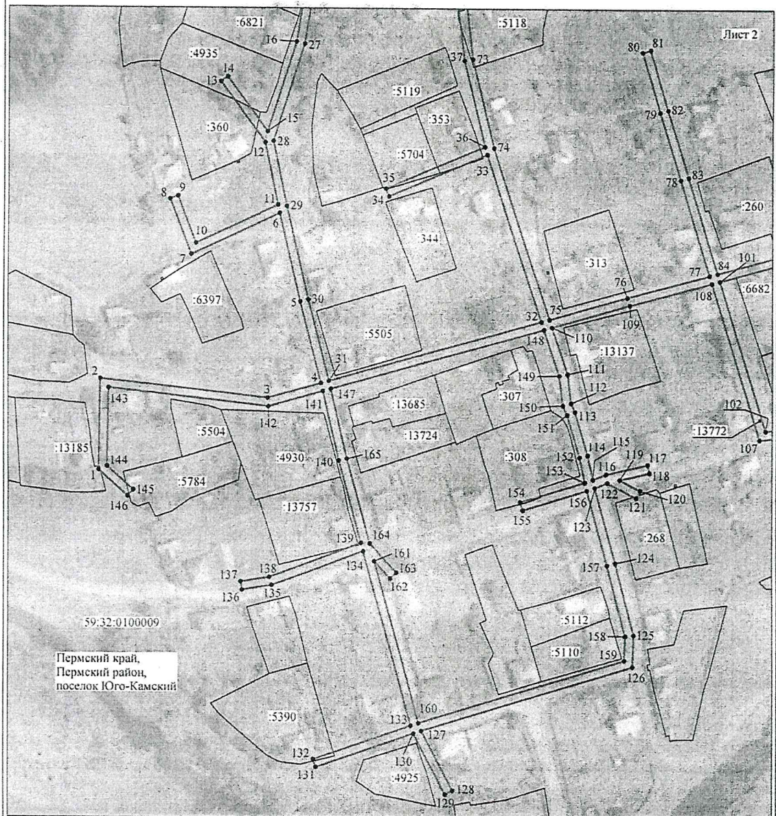
Схема расположения границ публичного сервитута объекта